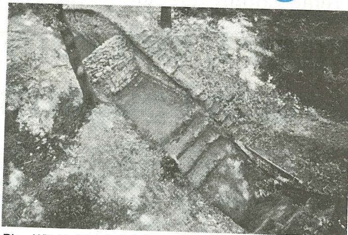
Die „Wittekindsburg“ bei Rulle wurde von Archäologen genau erforscht. Ähnlich könnte die Wallburg im Dörenther Berg ausgesehen haben. Querschnitt durch die Hauptbefestigung zeigt links den Wall, davor die Mauer, dann die Berme mit Versturzmateriale, rechts einen Spitzgraben.

Die ursprüngliche Form hat sich durch nachstrichende Erd- und Steinmassen völlig verändert und im Falle einer archäologischen Untersuchung müßte alles Versturzmateriale entfernt werden, um an die einstige Tiefe der Wälle zu gelangen. Als Ergebnis würde sich