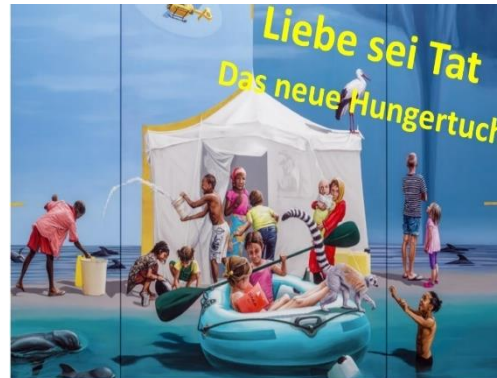
Das Misereor-Hungertuch 2025 „Gemeinsam träumen – Liebe sei Tat“ von Konstanze Trommer

Fr. 11.04. vorbereitet vom Kolping und Ökumenekreis